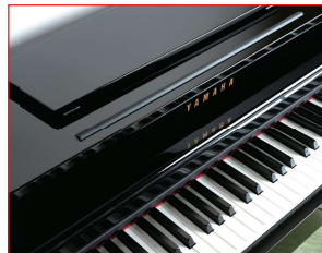
ピアノや車などの高級塗装品・車の内装