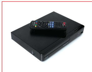
プラスチック素材